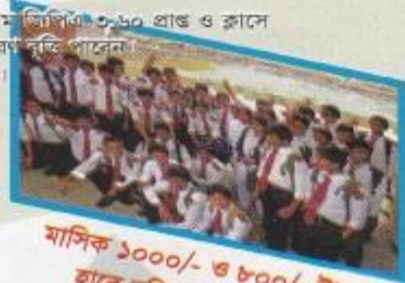
মাসিক ১০০০/- ও ৮০০/- টাকা হারে বৃত্তি পাবার সুযোগ

ডিপ্রোমা ইন ইঞ্জিনিয়ারিং উত্তীর্ণ ছাত্র-ছাত্রীগণ সরাসরি কর্মক্ষেত্রে যোগদান করতে পারবেন। সরকারি চাকুরীতে তারা ২য় শ্রেণীর গেজেটেড পদমর্যাদাপ্রাপ্ত হবেন। তবে যদি কেউ বি এসসি ইঞ্জিনিয়ারিং পড়তে আগ্রহী হন তাহলে বিসিএমসি ফাউন্ডেশন পরিচালিত বিসিএমসি প্রকৌশল ও প্রযুক্তি মহাবিদ্যালয়ে রাজশাহী বিশ্ববিদ্যালয়ের অধীন বি এসসি ইঞ্জিনিয়ারিং পড়ার সুযোগ পাবেন।